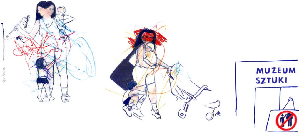
Grafika: Agnieszka Strzeżek